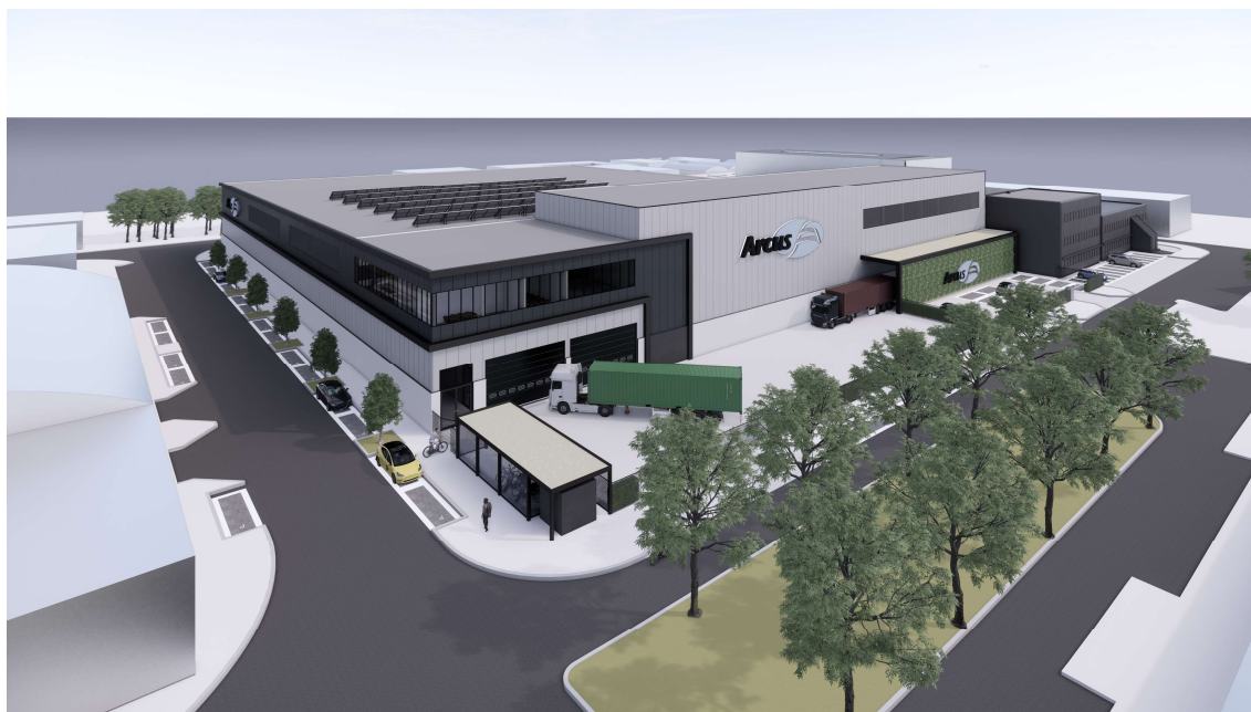
Impressie nieuwbouw Arcus vanuit hoek Newtonstraat - Nijverheidstraat

In december 2022 hebben we u geïnformeerd over het voornemen dat het bedrijf Arcus en het Havenbedrijf Rotterdam (HbR) willen investeren in de toekomst. De vergunningen zijn verleend en de voorbereidingen zijn inmiddels in een vergevorderd stadium. Zo heeft Arcus onlangs aan Unibouw de opdracht gegeven voor de werkzaamheden van de sloop en nieuwbouw.